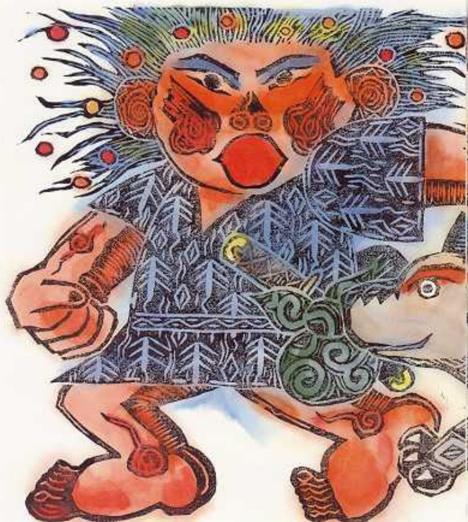
ももたろうさん ももたろうさん