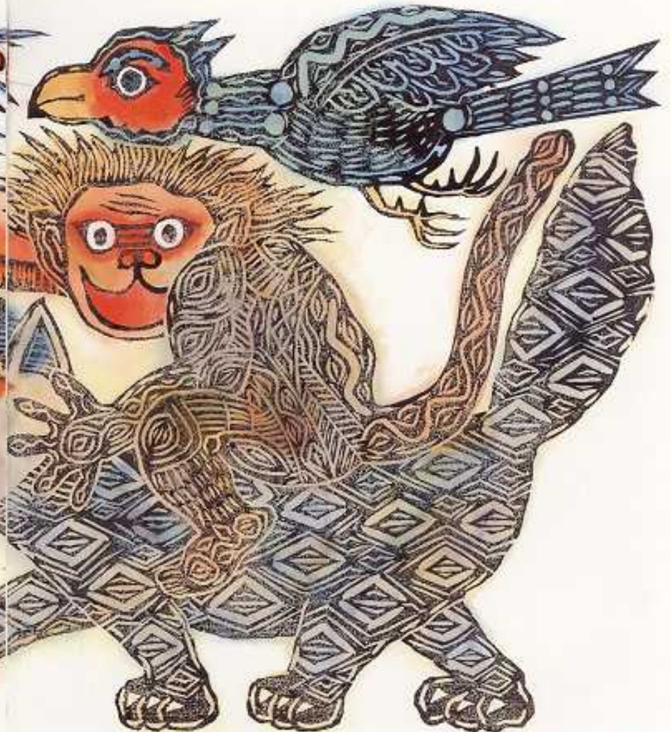
ぼくらも いくよ つれてって